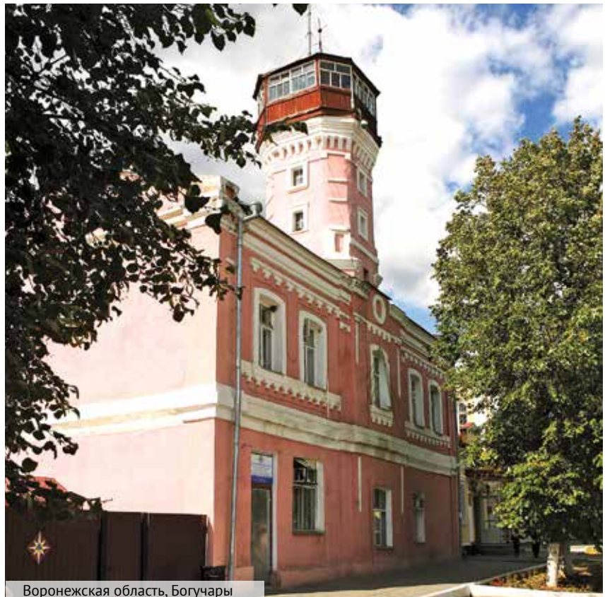
Воронежская область, Богучары

Простившись с красотами земли воронежской, отправляемся далее. Наше путешествие по городам и весям, по каланчам российским будет продолжено в следующем номере.