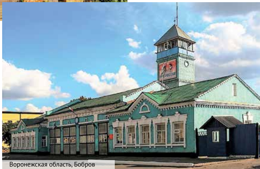
Воронежская область, Бобров

«Огромный пожарный двор был завален кучами навоза, выбрасываемого ежедневно из конюшен... Пожарные в двух этажах, низеньких