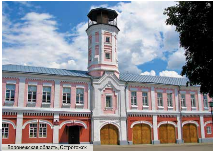
Воронежская область, Острогжск

Тем не менее выезд пожарной команды на тушение был одним из самых красочных и впечатляющих зрелищ того небогатого на события времени. Представьте, как разом